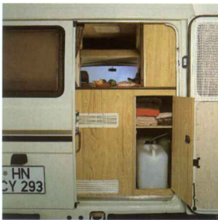
Von außen bequemes Einstellen der Gasflaschen und des Frischwassers, eigens zum Kochen