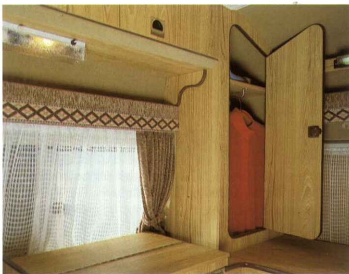
Auch Smoking und Abendkleid können mit: der Kleiderschrank (mit Wäschefach) sichert die Teilnahme an der Dinner-Party