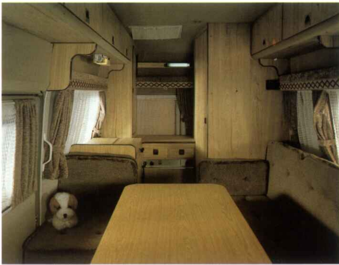
Blick vom Fahrerhaus in den Wohnraum: gediegen die Einrichtung, geschmackvoll die Farbabstimmung