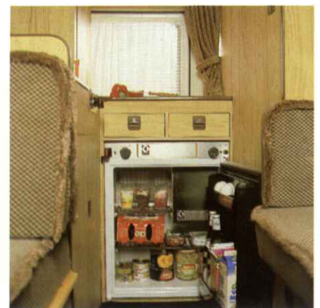
Der 60-l-Kühlschrank faßt so ziemlich alles, was die Familie auf Eis legen möchte