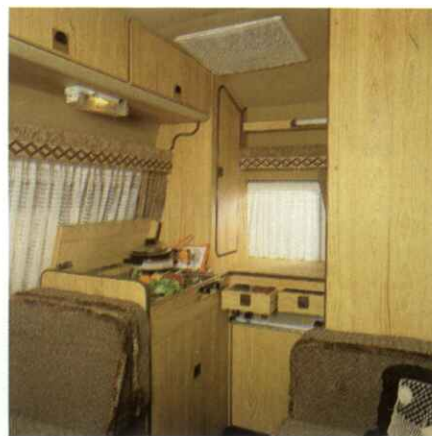
Kompakte Küche mit Spüle, viel Abstellplatz und Staumöglichkeiten. Schiebefenster und Dachlüfter für Dunstabzug