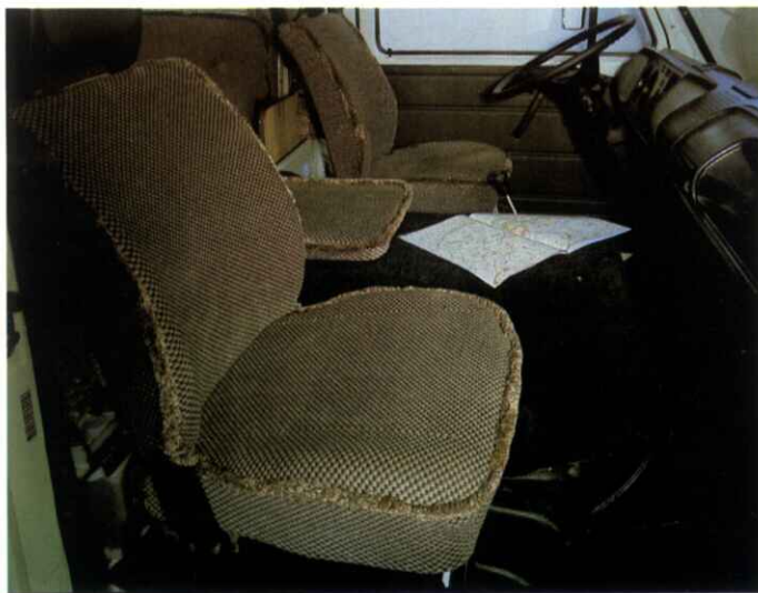
Nicht nur bequem, sondern auch optisch angepaßt: die Sitze im Fahrerhaus überzogen mit dem Polsterstoff des Wohnraums