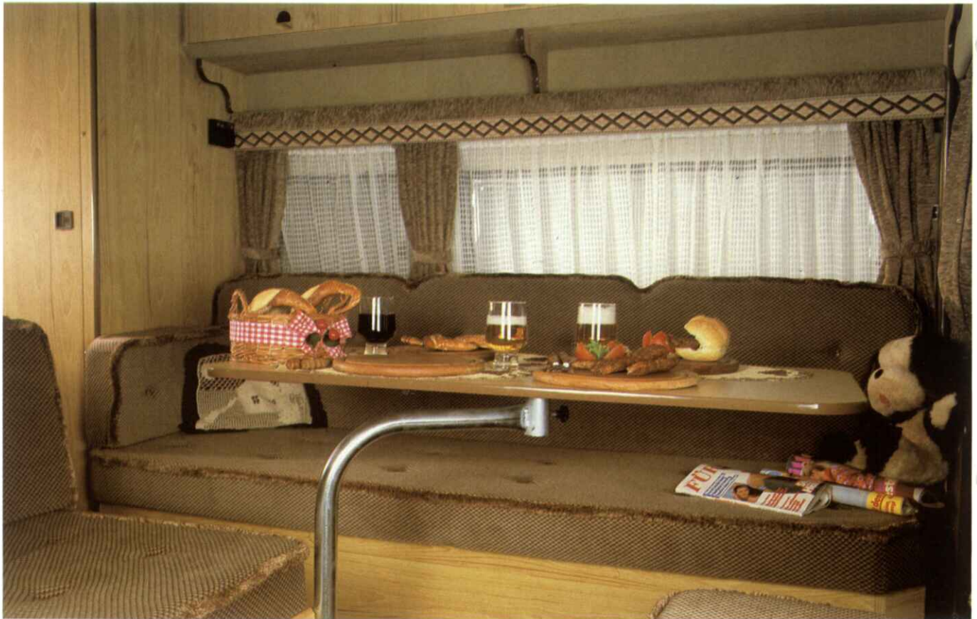
Ob Schwäbisches Vesper oder Bayerische Brotzeit – die gemütliche Sitzgruppe des LARGO bietet bis zu 6 Personen Platz zu einem »Picknick auf der Veranda«